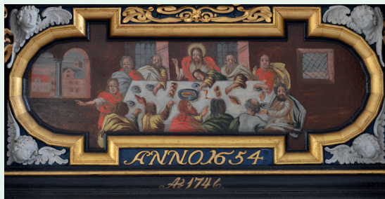
”Den sidste nadver”

Altartavlen er forsynet med årstallet 1654 og tilskrives slotssnedkeren på Frederiksborg slot, Claus Gabriel. Den rigt udskårne baroktavle har bevaret en arkitektonisk opbygning bestående af postament, storstykke og topstykke: Forneden i postamentets fyldning er der indsat et maleri over den sidste nadver og under det, ses det reliefskårne årstal. Storstykkets arkadefelt rummer en udskåret fremstilling af den korsfæstede Jesus, flankeret af Maria og Johannes og med en knælende Maria Magdalene ved korstræets fod.